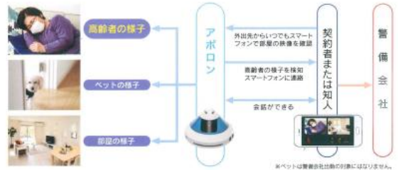
※ペットは警備会社出動の対象にはなりません。